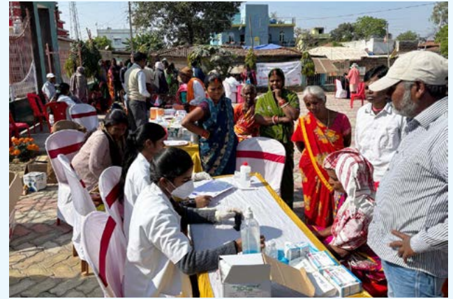
राँची के सुकुरहुडू बस्ती में जन आरोग्य केंद्र, सीसीएल द्वारा आयोजित स्वास्थ्य शिविर का एक दृश्य

ज्ञात हो कि सीसीएल देश की ऊर्जा जरूरतों को पूरा करने के लिए कोयला उत्पादन के साथ-साथ अपने कर्मियों एवं हितधारकों के स्वास्थ्य के प्रति सजग रहते हुए इस तरह का निःशुल्क स्वास्थ्य शिविरों का आयोजन समय-समय पर करते रहती है।