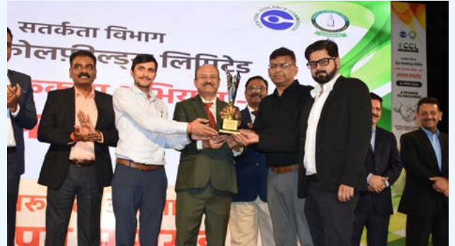
पुरस्कार ग्रहण करते सीसी एंड पीआर के अधिकारीगण