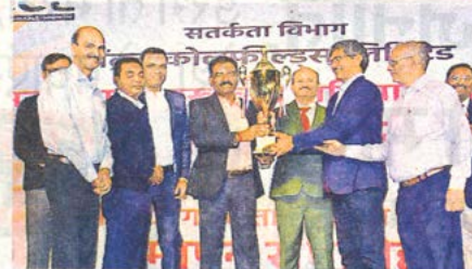
सीसीएल के सतर्कता जागरूकता अभियान के समापन में शामिल सीएमडी व अन्य।

सीसीएल के सतर्कता जागरूकता अभियान-2024 का समापन