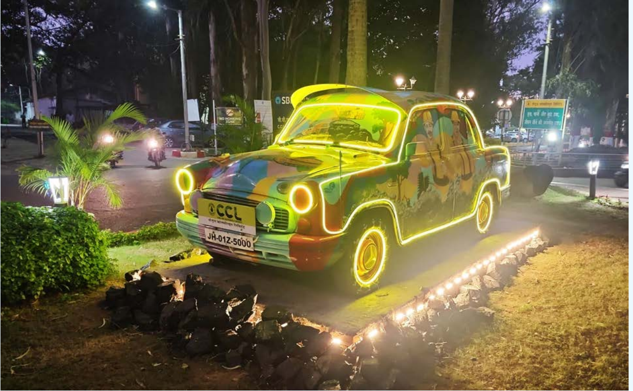
भारत सरकार के स्पेशल कैम्पेन 4.0 योजना के तहत बेकार पड़े पुराना एम्बेसडर कार (कबाड़) को जीवित रंगों से सजाकर कंचन बना दिया गया

सेंट्रल कोलफील्ड्स लिमिटेड यानी झारखंड की लाइफलाइन, ने रचनात्मकता की मिसाल कायम करते हुए एक पुरानी एवं बहुत दिनों से उपयोग में नहीं होने वाले, बेकार पड़े एम्बेसडर कार को कला के माध्यम से एक शानदार नमूने में सफलतापूर्वक बदला है। भारत सरकार, 17 के स्पेशल कैम्पेन 4.0 की योजना के तहत की गई इस पहल ने वाहन में नई जान फूंक दी है, जिससे कंपनी के मुख्यालय परिसर की सुंदरता बढ़ गई है एवं यह कलाकृति एक आकर्षण का केंद्र बन गया है।