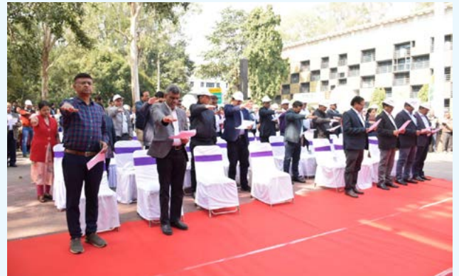
संविधान दिवस के अवसर पर शपथ ग्रहण करते सीसीएल के कर्मचारी एवं अधिकारीगण