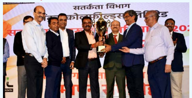
पुरस्कार ग्रहण करते क्षेत्र के अधिकारीगण