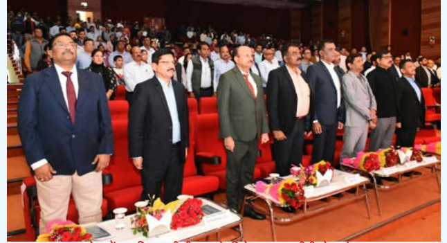
समापन समारोह में उपस्थित सीसीएल के निदेशकगण, सीवीओ एवं अन्य गणमान्य

महीने चलने वाले सतर्कता जागरूकता अभियान 2024 का उद्देश्य सभी को सत्यनिष्ठा, ईमानदारी और सतर्कता के मूल्यों को आत्मसात करने के लिए प्रेरित करना था।