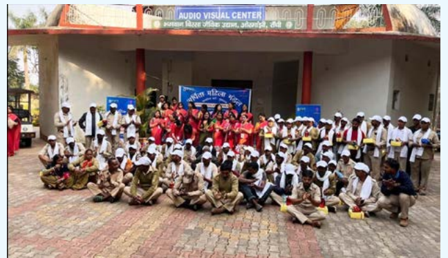
भगवान बिरसा जैविक उद्यान के कर्मियों के साथ अर्पिता महिला मंडल के सदस्यवृंद