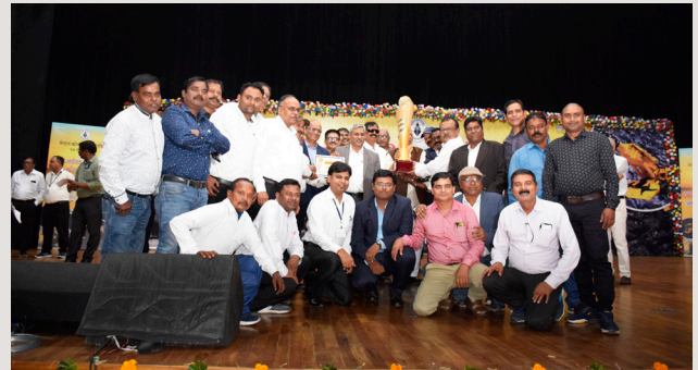
सीआईएल/सीसीएल के 48वां स्थापना दिवस के अवसर पर उत्कृष्ट प्रदर्शन करने के लिए प्राप्त पुरस्कार के साथ सीसीएल के विभिन्न क्षेत्रों के कर्मिक

इस अवसर पर कंपनी के लिए उत्कृष्ट प्रदर्शन करने के लिए विभिन्न श्रेणीयों में पुरस्कार दिए गए जिनमें शॅवेल ऑपरेटर, डम्पर ऑपरेटर, ड्रिल ऑपरेटर, डोजर ऑपरेटर, पे-लोडर, एसडीएल ऑपरेटर एवं स्पेशल एचिवमेंट के लिए चयनित कर्मिकों को प्रथम, द्वितीय एवं तृतीय पुरस्कार से नवाजा गया। सीसीएल के विभिन्न क्षेत्रों एवं विभागों को भी अच्छे कार्य के लिए पुरस्कार से सम्मानित किया गया।