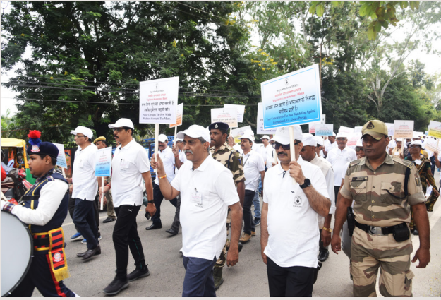
सतर्कता जागरूकता मार्च का एक दृश्य

अवसर विशेष पर सीसीएल के सीएमडी, निदेशकगण एवं कर्मी प्रातः मुख्यालय प्रांगण में उपस्थित हुए और सतर्कता जागरूकता रथ के