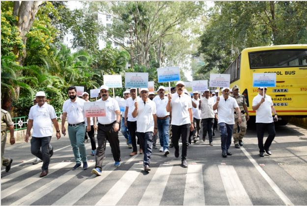
सतर्कता जागरूकता मार्च का एक दृश्य

साथ-साथ प्ले कार्ड, बैनर आदि को हाथ में लेकर 'भ्रष्टाचार मुक्त भारत वृ विकसित भारत' का संदेश देते हुए सीसीएल के मुख्य द्वार से राजभवन के मुख्य द्वार होते कांके रोड स्थित जवाहरनगर कॉलोनी तक सतर्कता मार्च निकाली। इसमें स्कूली छात्र ने भी बैंड बाजा के साथ भाग लिया और सतर्कता जागरूकता रथ में भी भ्रष्टाचार मुक्त संबंधी गाने बजे और लोगों को इसके बारे में जागरूक किया गया।