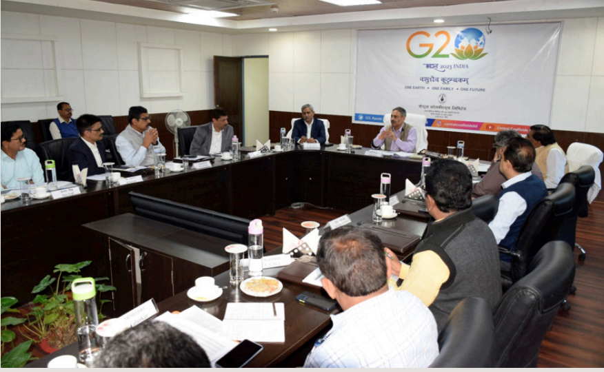
समीक्षा बैठक का एक दृश्य