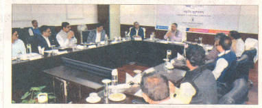
राष्ट्रीय सागर संवाददाता