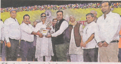
सीसीएल के स्थापना दिवस समारोह में उपस्थित लोग