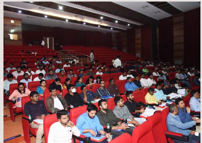
कार्यशाला में उपस्थित प्रबंधन प्रशिक्षुगण