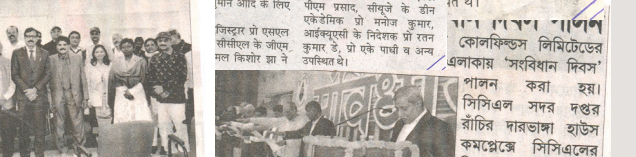
सीसीएल में एक दिवसीय कार्यशाला का आयोजन