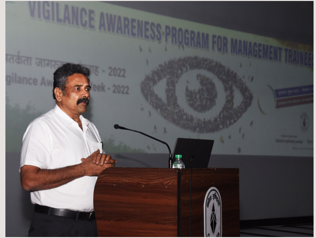
कार्यशाला को संबोधित करते हुए एक अधिकारी

सतर्कता जागरूकता सप्ताह 2022 के अंतर्गत दिनांक 04 नवम्बर को सीसीएल मुख्यालय के कंवेनशन सेंटर में प्रशिक्षु प्रबंधन (मैनेजमेंट ट्रेनीज) के लिए एक कार्यशाला का आयोजन किया गया। ज्ञात हो कि पूरे सीसीएल में 31 अक्टूबर से 6 नवंबर, 2022 तक सतर्कता जागरूकता सप्ताह मनाया जा रहा है जिसके तहत कंपनी में भ्रष्टाचार के खिलाफ सभी लोगों को जागरूक करने के लिए विभिन्न कार्यक्रम आयोजित किए जा रहे हैं। इसके लिए कंपनी के सभी नियम-कानून की जानकारी हरेक अधिकारी एवं कर्मचारी को होना बहुत जरूरी है। इसलिए कार्यशाला का मुख्य उद्देश्य नवनियुक्त अधिकारियों यानि प्रशिक्षु प्रबंधन (मैनेजमेंट ट्रेनिज) को कंपनी के विभिन्न मैनुअलों, जैसे विजिलेंस मैनुअल, कंडक्ट, डिसिप्लिन एंड अपील रूल एवं सर्टिफाइड स्टैंडिंग ऑर्डर के बारे में विस्तार से अवगत कराना था। इस अवसर पर सैकड़ों प्रशिक्षु प्रबंधन (एमटी) उपस्थित थे। सभी ने इस कार्यशाला में उत्सुकतापूर्वक भाग लेते हुए कंपनी के नियम-कानून के बारे में जानकारी हासिल की।