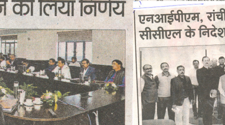
सीसीएल में निदेशक वित्त की बैठक.

रांची। सीसीएल दरभंगा हाउस में कोल इंडिया लिमिटेड के वित्त निदेशकों का दो दिवसीय सम्मेलन